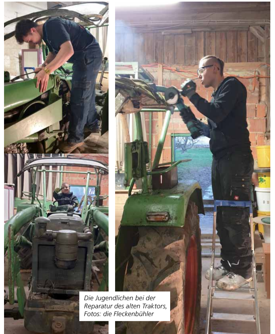
Die Jugendlichen bei der Reparatur des alten Traktors

Seit Oktober 2024 Pädagogischer Leiter der Fleckenbühler Jugendhilfe Leimbach