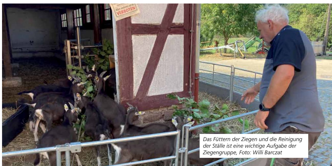
Das Füttern der Ziegen und die Reinigung der Ställe ist eine wichtige Aufgabe der Ziegengruppe, Foto: Willi Barczat