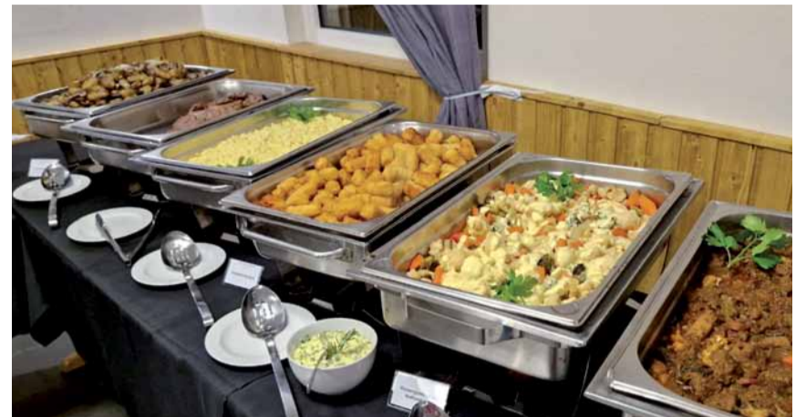
Es kann losgehen, das Buffet ist aufgebaut