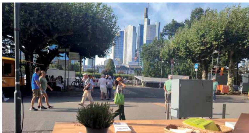
Der Stand auf dem Museumsuferfest war ein voller Erfolg