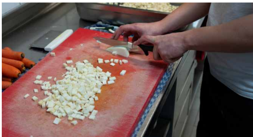
... dann geht das Schnippeln besser