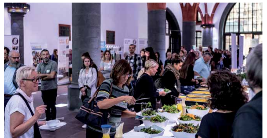
Das Fleckenbühler Buffet beim Tag der fairen Beschaffung im Römer