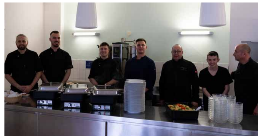
Das Küchenteam im Haus Frankfurt