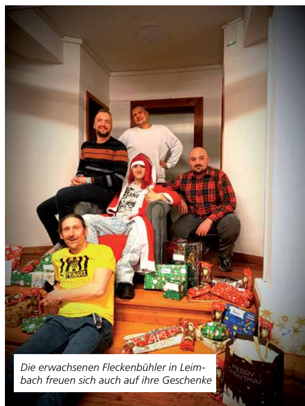
Die erwachsenen Fleckenbühler in Leimbach freuen sich auch auf ihre Geschenke