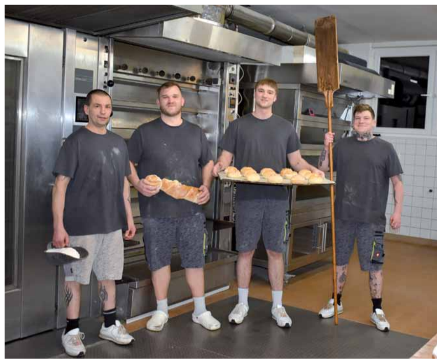
Das Bäckerei-Team gut gelaunt bei der Arbeit