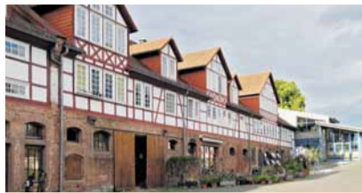
Hof Fleckenbühl Fleckenbühl 6 35091 Cölbe-Schönstadt

auf Hof Fleckenbühl und im Haus Frankfurt