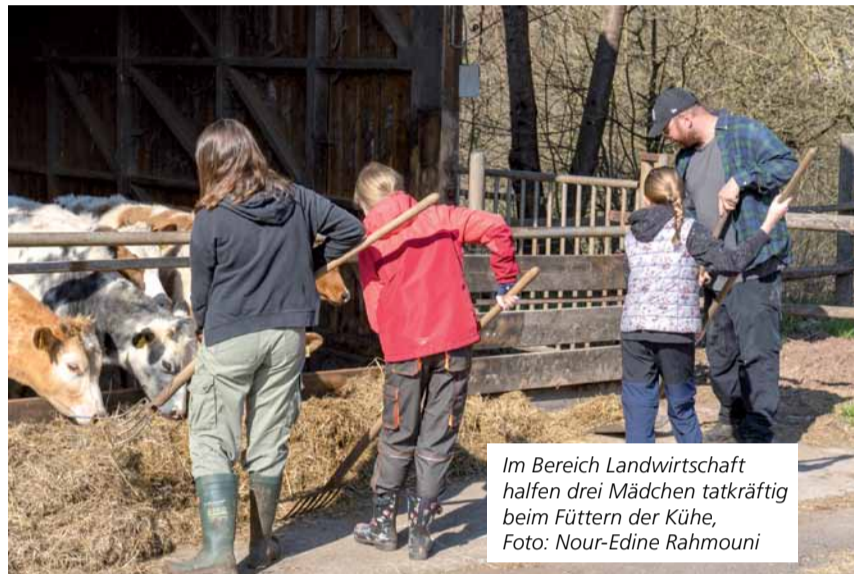
Im Bereich Landwirtschaft halfen drei Mädchen tatkräftig beim Füttern der Kühe