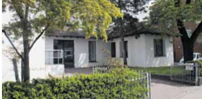
Haus Frankfurt Kelsterbacher Straße 14 60528 Frankfurt

16. Juni 19-21 Uhr Fleckenbühler Hofkonzert mit dem Eliot Quartett und Ella van Poucke 27. September 15-18 Uhr Offenes Haus – Kränze binden 27. September 19 Uhr Fleckenbühler Hofkonzert mit Quatuor Voce