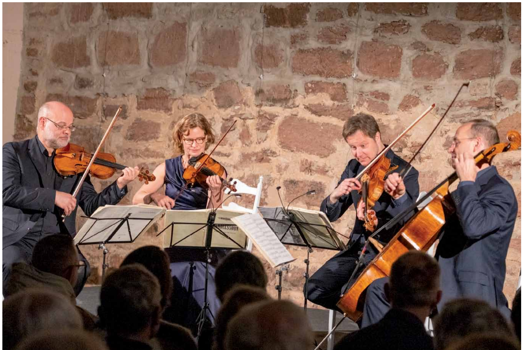
Ein großartiges Ensemble im besonderen Ambiente der Festscheune

Das Programm mit den drei Streichquartetten von Felix Mendelssohn Bartholdy durchmaß fast dessen ganzes Komponistendasein. Eröffnet wurde der Abend mit op. 13 (a-moll), einem Werk des 18-jährigen, der das Glück hatte, in einem musikalischen Haus aufzuwachsen, vielseitige Förderung zu erhalten