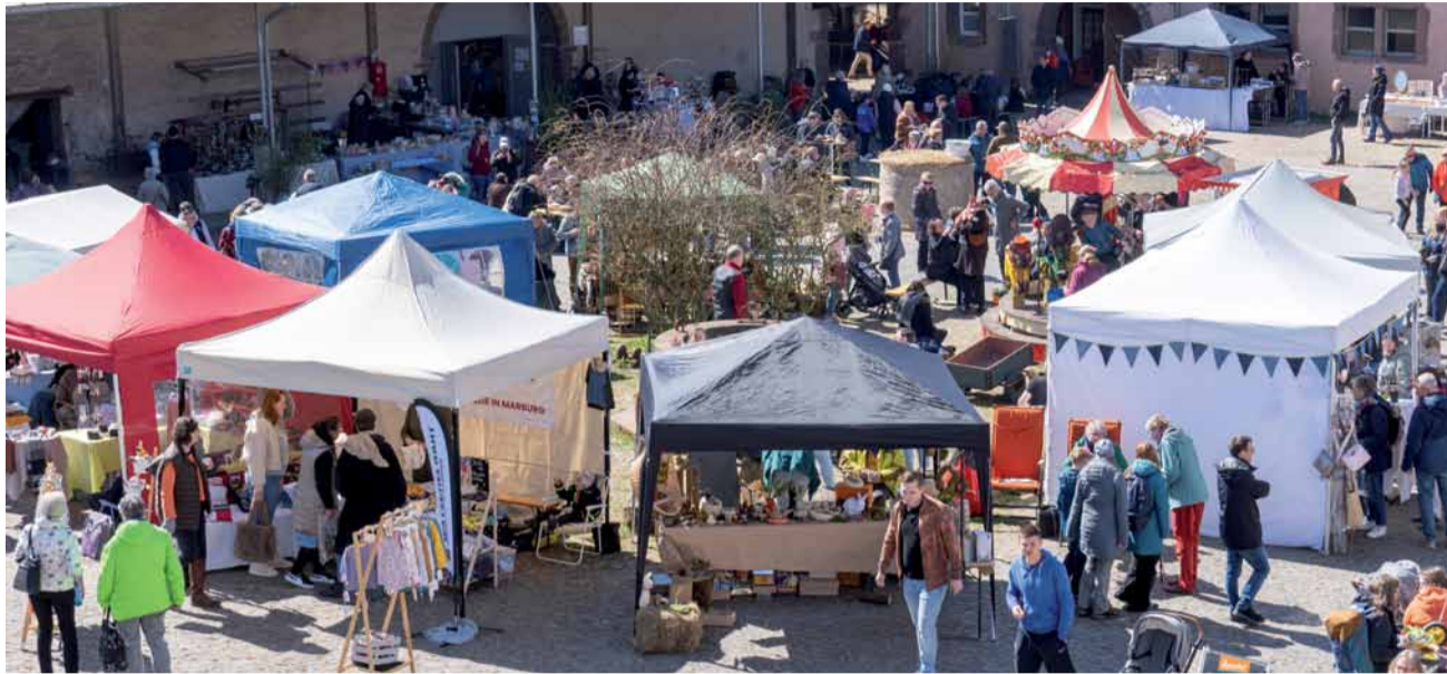
Der Innenhof voller bunter Stände und vieler Besucher, die das selbstgemachte Kunsthandwerk bewundern

Ein Sonntag wie aus dem Bilderbuch: Sonne, leichte Brisen und der Hof und die Festscheune schon voller bunter Stände: Schöne selbstgemachte Kunsthandwerke!