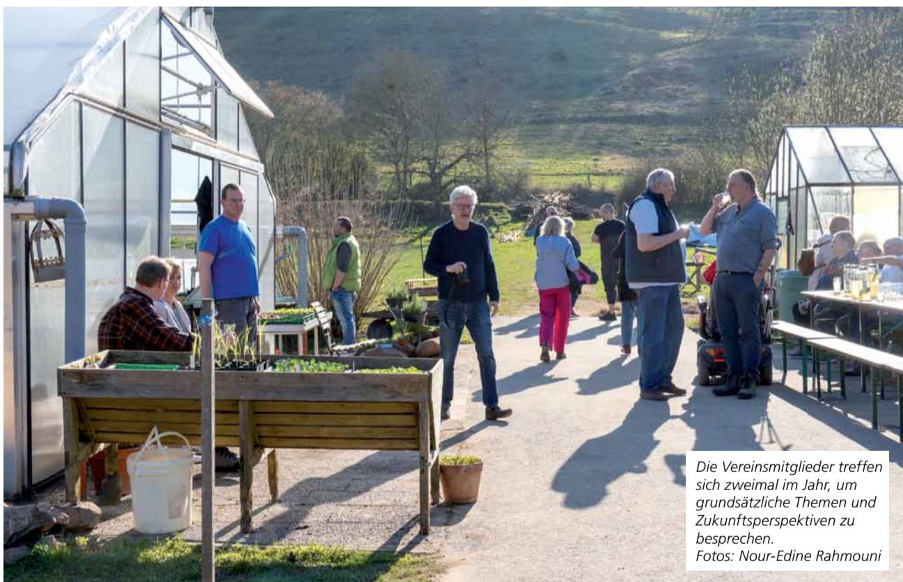
Die Vereinsmitglieder treffen sich zweimal im Jahr, um grundsätzliche Themen und Zukunftsperspektiven zu besprechen.