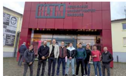
Die Fleckenbühler im Hessischen Landestheater Marburg Auf Einladung des Hessischen Lan-

Die Mitglieder unseres Vereins aus den Standorten „Haus Frankfurt“, „Jugendhilfe Leimbach“ und „Hof Fleckenbühl“ kamen zur halbjährlichen Vereinsklausur auf dem Hof Fleckenbühl in Cölbe-Schönstadt zusammen. Wie gewohnt nehmen wir uns zweimal im Jahr ein ganzes Wochenende Zeit, um aktuelle Themen, Herausforderungen und Zukunftsperspektiven intensiv zu besprechen. Wichtige Themen waren: Wie kann das Älterwerden innerhalb der Fleckenbühler Gemeinschaft gestaltet werden, welche Herausforderungen bringt es mit sich und was ist notwendig, um den Bedürfnissen aller gerecht zu werden? Ein anderes Thema war die Umstellung auf ein neues Betriebssystem in unserer IT-Infrastruktur.