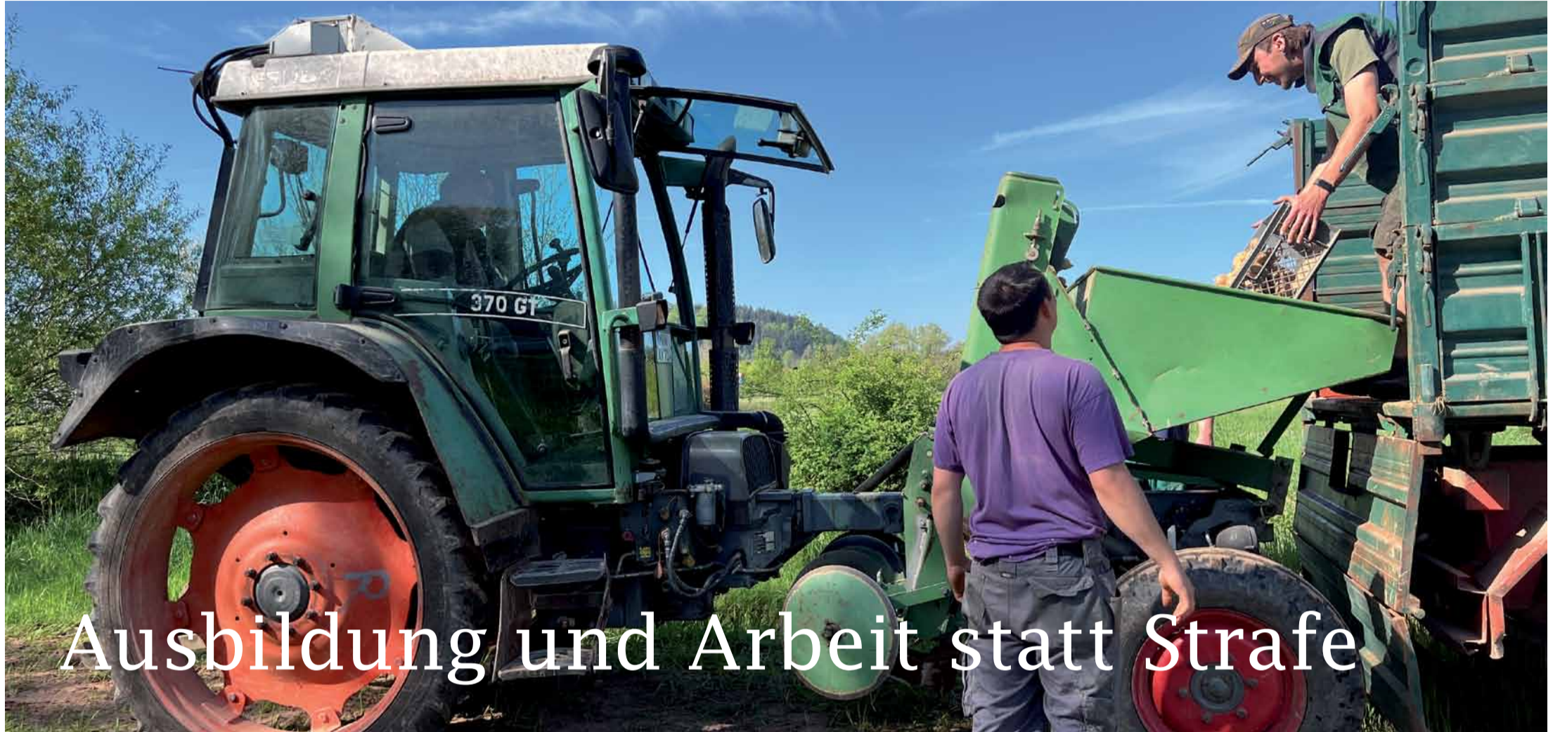
die Fleckenbühler bieten viele Möglichkeiten der beruflichen Qualifizierung. Das wäre ohne Zuweisung von Geldauflagen nicht möglich, Foto: Eva Vogler