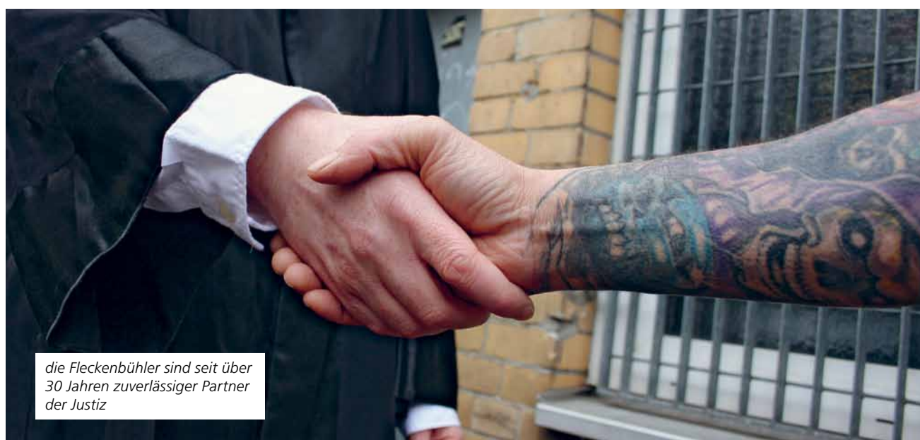
die Fleckenbühler sind seit über 30 Jahren zuverlässiger Partner der Justiz