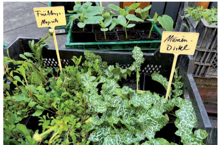
Die Hauptattraktionen waren: Wildkräuter, Kräuter, Blumen vom Fleckenbühler Hof und der Jugendhilfe Leimbach. Gesundes mit Kräutern herstellen und Kräutersträuße binden. Ein Barfußpfad und Leckereien aus der Küche und der Bäckerei. Ein Flohmarkt und ein Glücksrad. Das Ganze musikalisch untermalt von den „Singing Sixties“