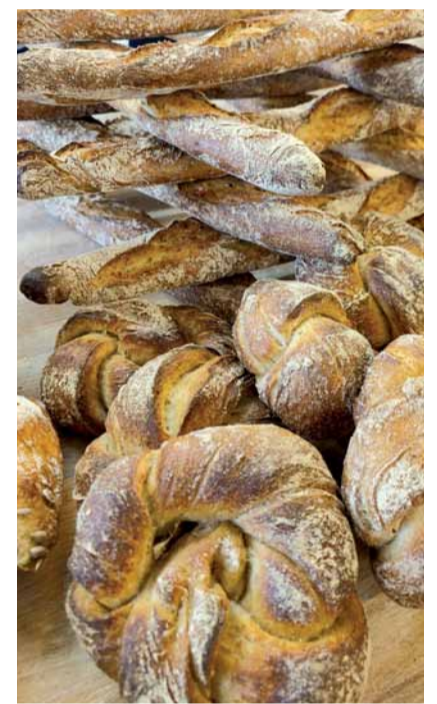
Auch im Angebot: Wurzelbrot und Baguette