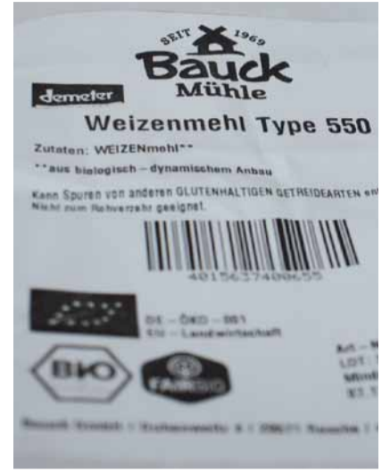
Hochwertige Zutaten sind in der Fleckenbühler Backstube wichtig