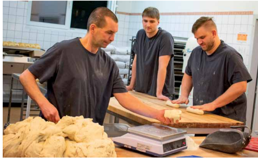
Abwiegen, kneten, ruhen lassen. Die Abfolge der Arbeitsabläufe ist klar festgelegt