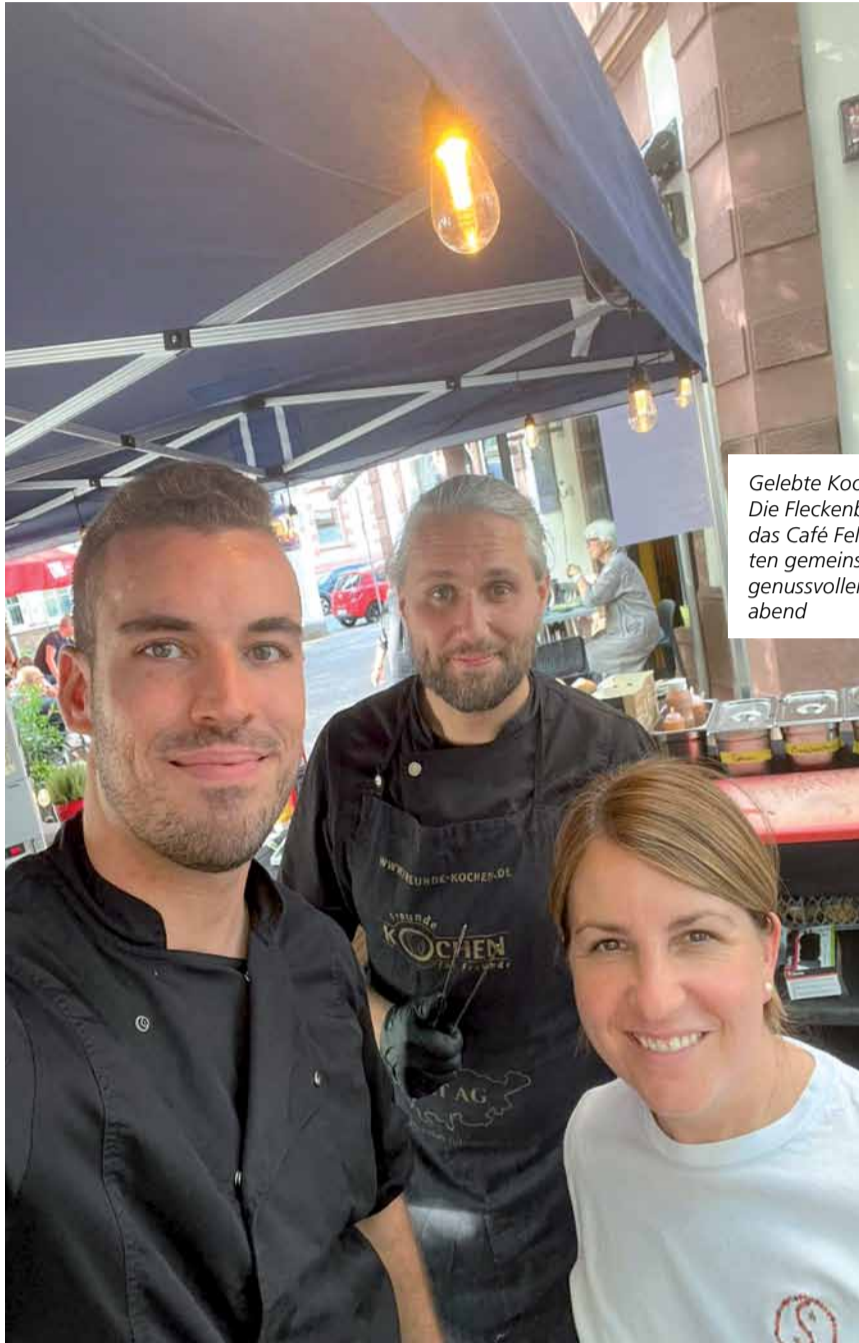
Gelebte Kooperation: Die Fleckenbühler und das Café Fellini gestalten gemeinsam einen genussvollen Sommerabend

Ein Rückblick auf das gemeinsame Event der Fleckenbühler und dem Café Fellini in Frankfurt-Sachsenhausen