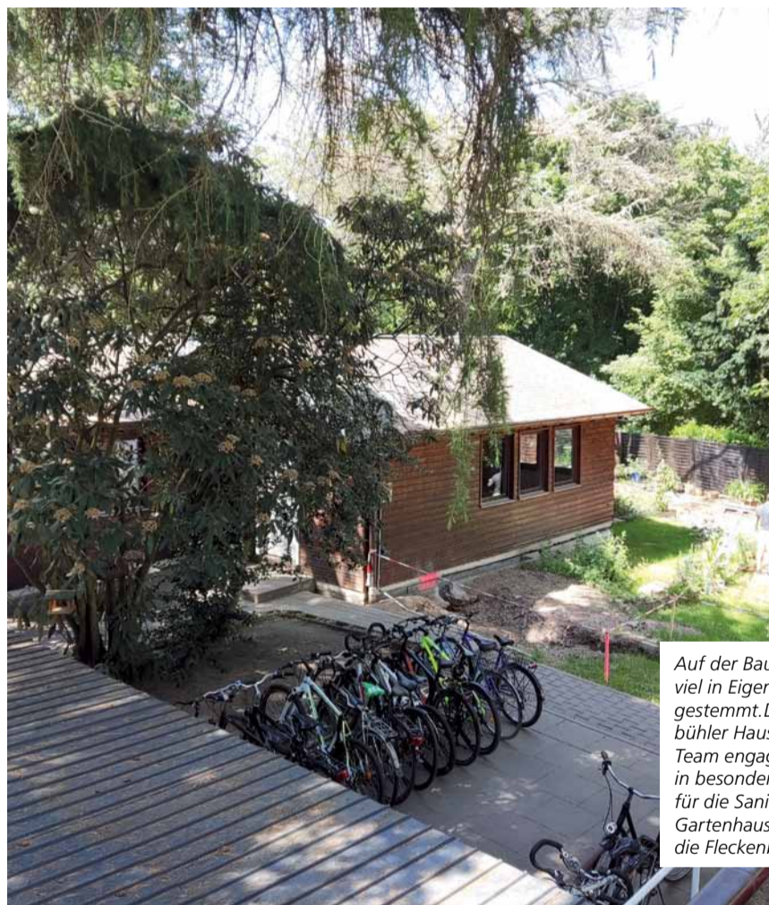
Auf der Baustelle wird viel in Eigenleistung gestemmt. Das Fleckenbühler Haustechnik-Team engagiert sich in besonderem Maß für die Sanierung des Gartenhauses