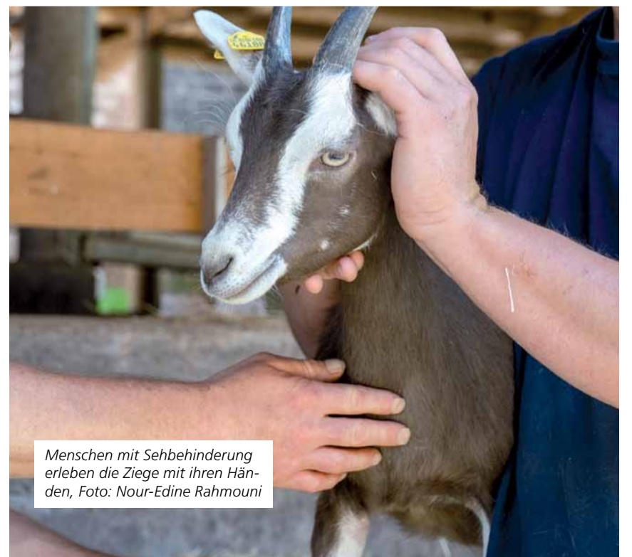
Menschen mit Sehbehinderung erleben die Ziege mit ihren Händen