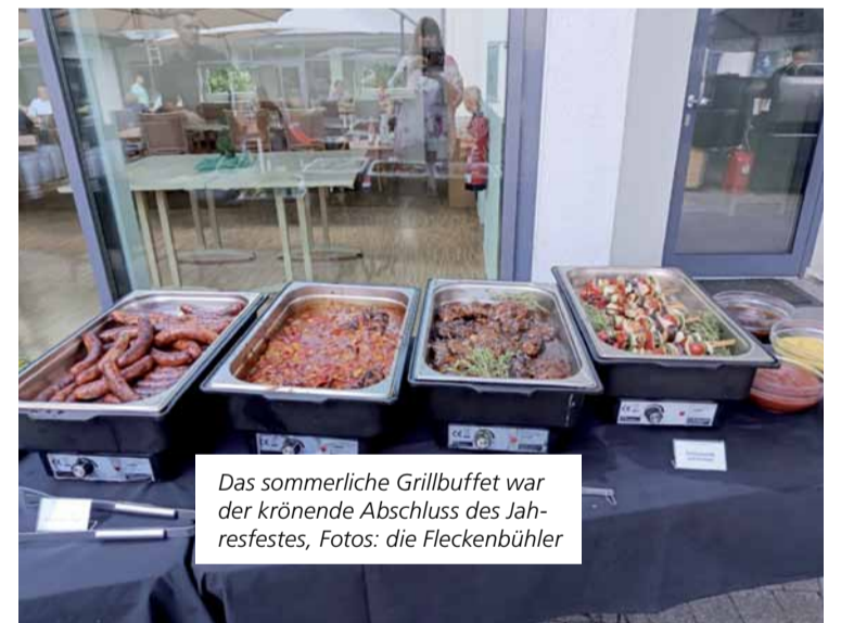
Das sommerliche Grillbuffet war der krönende Abschluss des Jahresfestes