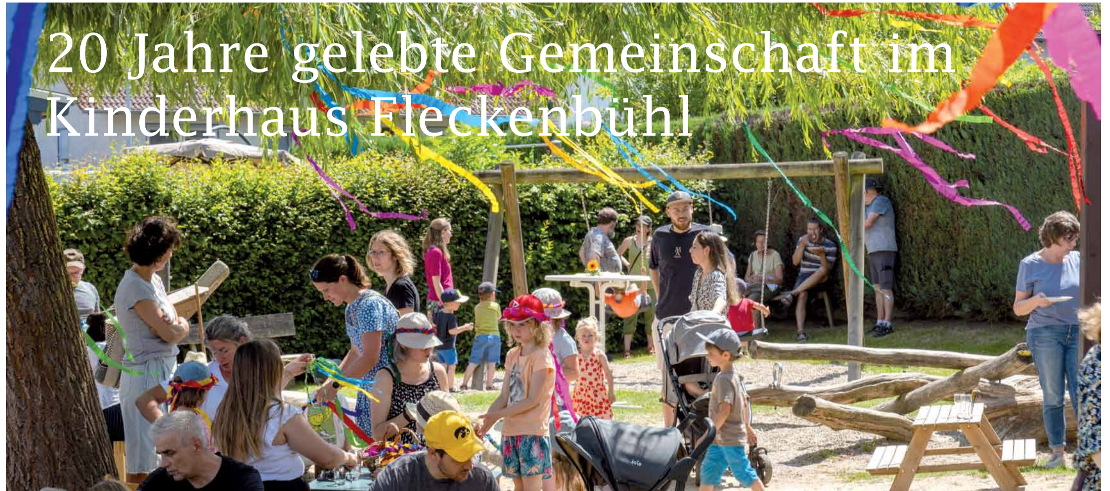
Zum Jubiläumsfest bei strahlendem Sonnenschein kamen viele große und kleine Gäste, Fotos: Nour-Edine Rahmouni