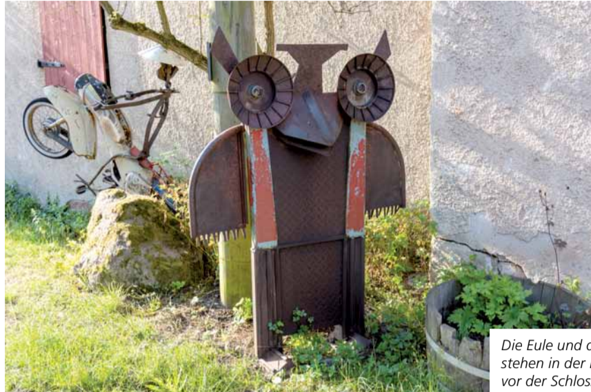
Die Eule und der Mopedfahrer stehen in der Einfahrt zum Hof vor der Schlosserei, in der Günter gearbeitet hat. Günter fertigte seine Skulpturen aus Teilen, die bei der Arbeit übrigblieben. Von klein bis riesengroß hat er seine Skulpturen geschaffen, Fotos: Nour-Edine Rahmouni

Zusammen mit Ingrid habe ich angefangen, die teils ganz schön versteckten Skulpturen zu finden, zu benennen und gemeinsam zu planen, wie sie für die Zukunft konserviert werden sollen, wie sie vielleicht