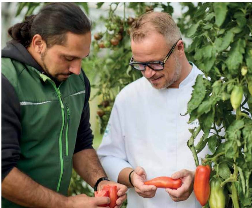
Ein buntes Jahr mit vielen Herausforderungen, aber auch toller Unterstützung und Motivation, Fotos: David Rempfen

Das Gartenjahr 2025 im Schul- und Lehrgarten von Hof Fleckenbühl war geprägt von Vielfalt, Herausforderungen, und großer gemeinschaftlicher Unterstützung.