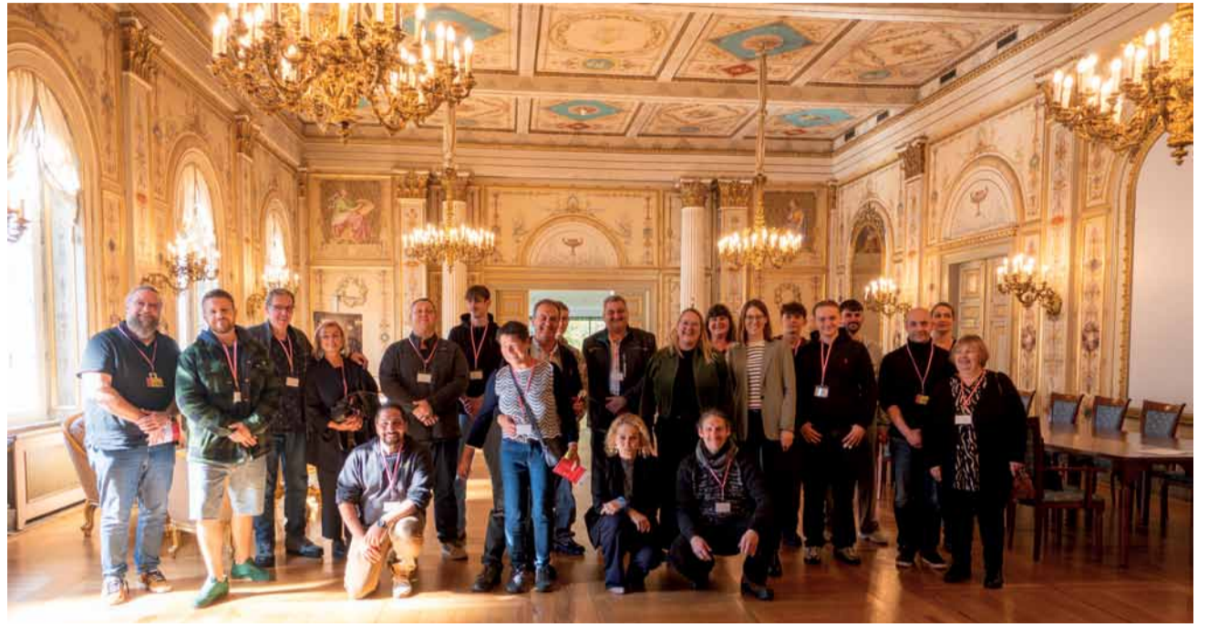
Die Fleckenbühler waren beeindruckt von den vielen spannenden Einblicken in den politischen Alltag im Hessischen Landtag