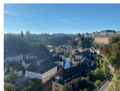
Tagesaufflug nach Luxembourg