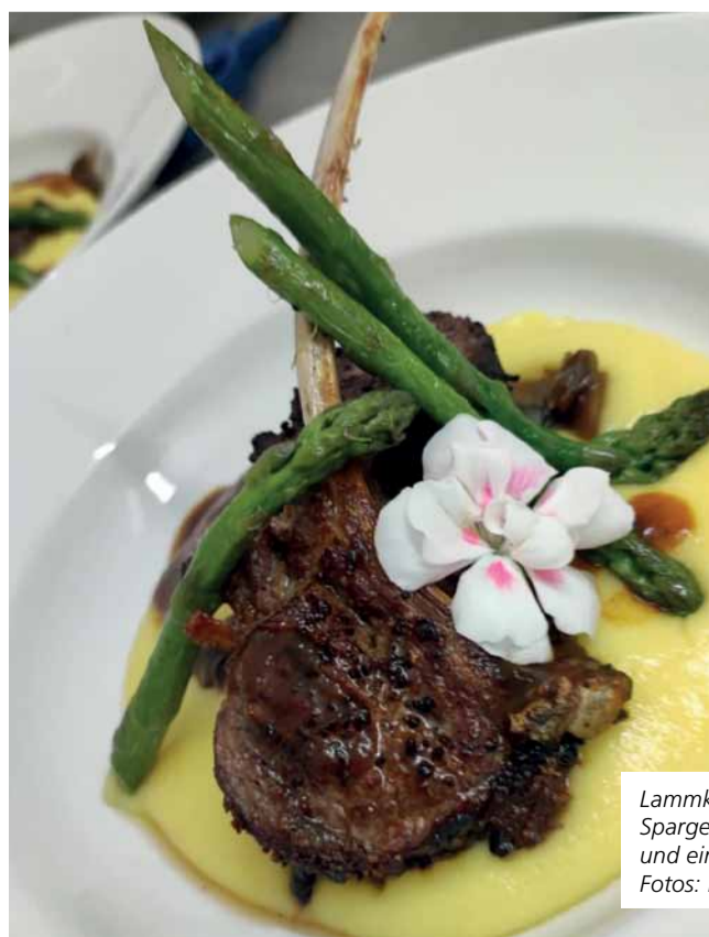
Lammkotelett mit grünem Spargel auf Kartoffelpüree und ein feines Dessert