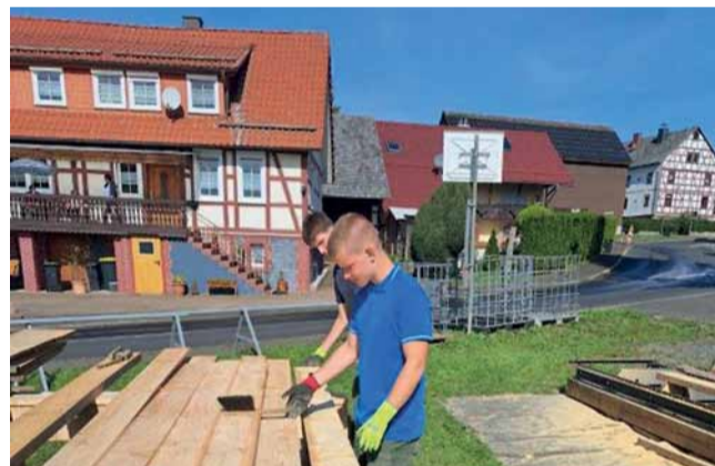
Die Jugendlichen in Leimbach in verschiedenen Qualifizierungsbereichen. Ein wichtiger Schritt zur Berufsfindung, Fotos: die Fleckenbühler