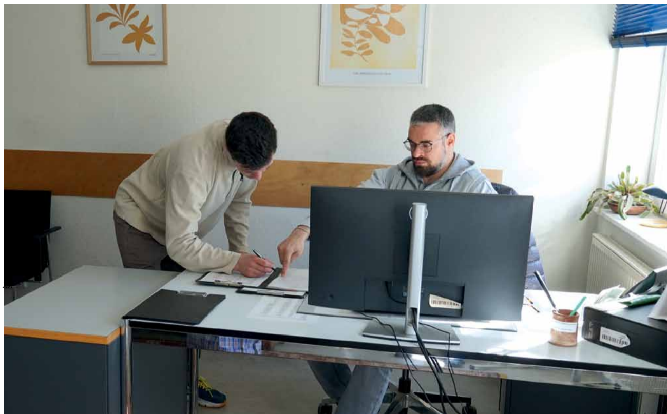
Der Empfang im Aufnahmehaus, Foto: Nour-Edine Rahmouni

Innerhalb der ersten 14 Tage geht die Hälfte der Leute fast immer in ihr altes Leben zurück